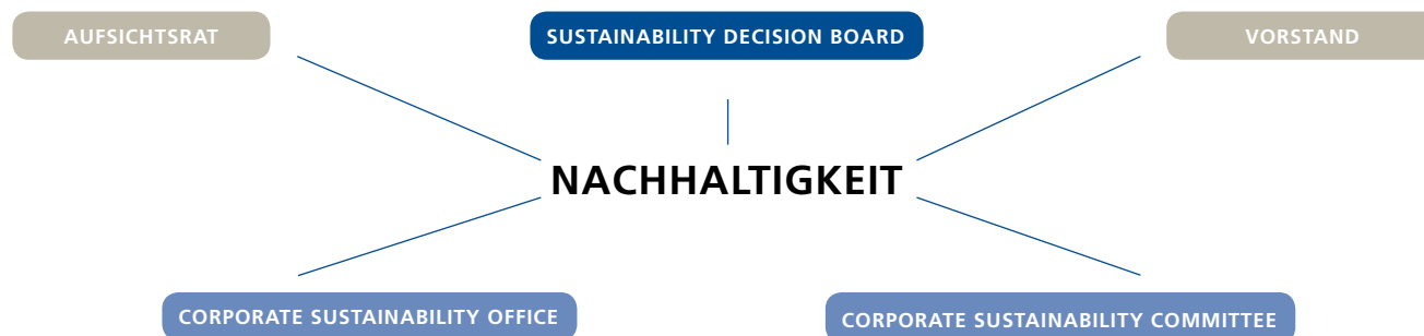
G 3.1 STRUKTUR DES GLOBALEN NACHHALTIGKEITSMANAGEMENTS

Als global agierendes Unternehmen haben unsere Geschäftsaktivitäten Auswirkungen auf viele Stakeholder-Gruppen wie Patienten, Mitarbeiter, Lieferanten und Aktionäre sowie Vertreter aus Wissenschaft, Politik und Gesellschaft. Den Dialog mit unseren Stakeholdern erachten wir als essenziell, um