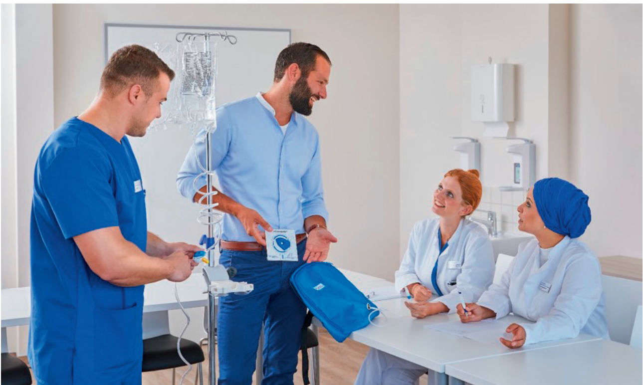
Produktspezifische Anwenderschulungen direkt im Dialysezentrum vermitteln dem gesamten PD Team vor Ort praxisrelevantes Fachwissen und die benötigten Handgriffe für den Behandlungsverlauf.